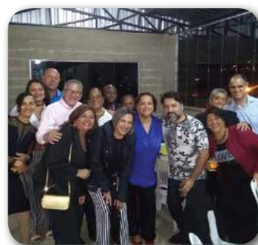
Cooperados de Barbacena