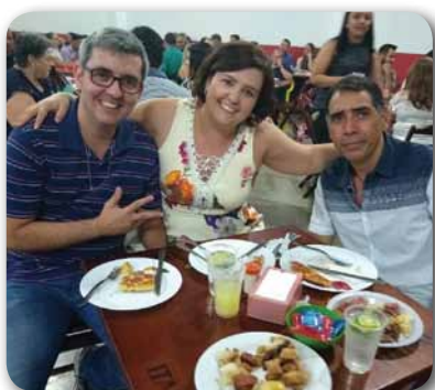
Encontro Amigos Cecref em Patos de Minas