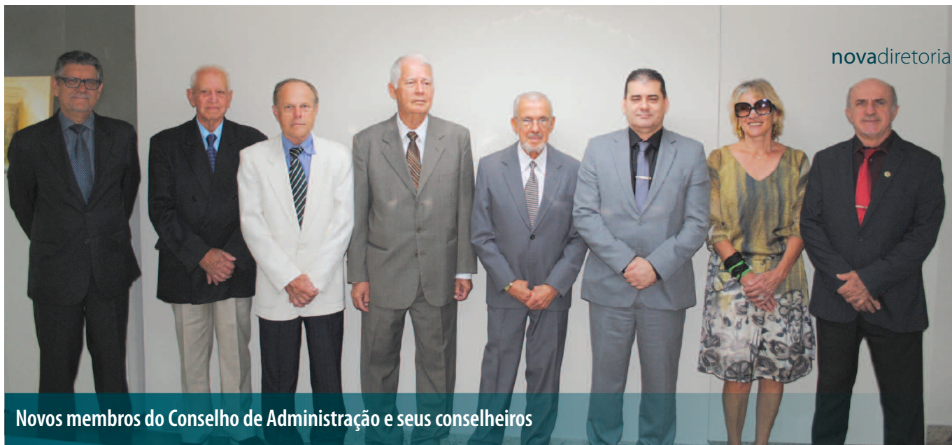
Novos membros do Conselho de Administração e seus conselheiros