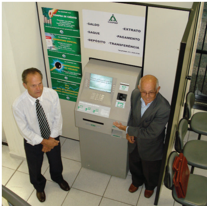
• Caixa eletrônico instalado para facilitar as transações com segurança

na área de atendimento ao público, está instalado um ATM (caixa eletrônico), por meio do qual os associados poderão fazer, com facilidade e segurança, saques, consultas de saldos, transferências, pagamentos e retirar extratos.