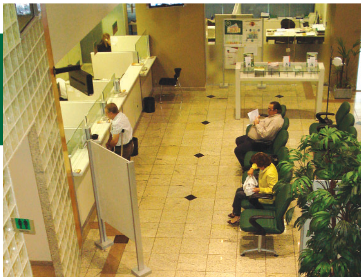
• Cooperativa mantém resultado positivo

COOPSEF mantém sua boa situação financeira, mesmo depois que associado decide sacar recursos das Sobras