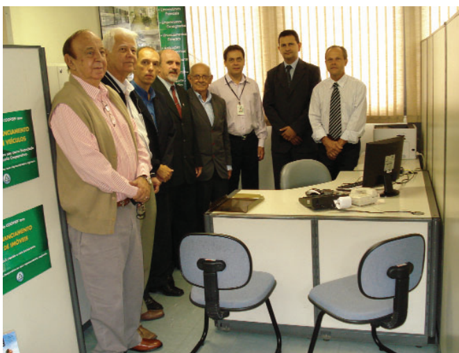
• COOPSEF cria novo espaço para atendimento aos associados

Os servidores fazendários da Superintendência Regional da Fazenda/Contagem estão comemorando. No dia 12 de maio foi inaugurada a Representação Regional da COOPSEF na sede dessa SRF, localizada na avenida Babita Camargo, 766, 3º andar. No térreo,