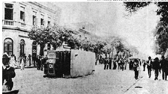
Bonde virado pela população na Praça da República durante a revolta.

HTTPS://PT.WIKIPEDIA.ORG/WIKI/REVOLTA_DA_VACINA