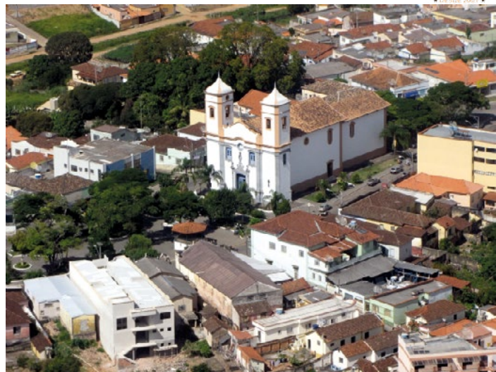
Vista aérea do Centro

Em divisão administrativa referente ao ano de 1933, o município constituído de 5 distritos: Bom sucesso, Santo Antonio do Amparo, Ibituruna (ex-São Gonçalo de Ibituruna, São Tiago e Macaia.