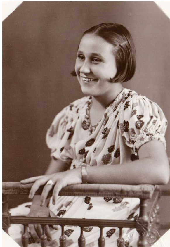
Selma em 1940

Quando deixou o Pampulha late Club, transferiu seu curso de atualização cultural, aonde circularam grandes nomes da cultura, desde escritores, psicólogos,