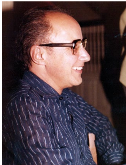
Na celebração dos seus vinte e cinco anos de sacerdócio no Rio de Janeiro - 1982

e inculturação da fé; Os religiosos vocação e missão; Oração na vida, desafio e dom; Modernidade e cristianismo. o desafio à inculturação: Educação, Sociedade e Justiça; Entroncamentos e Entrelaçamentos: Temas do Homem na agenda de Deus; Leste Europeu, inesperada convulsão: Vidas consagradas, rumos e encruzilhadas e organizou os Bilhetes de Dom Luciano.