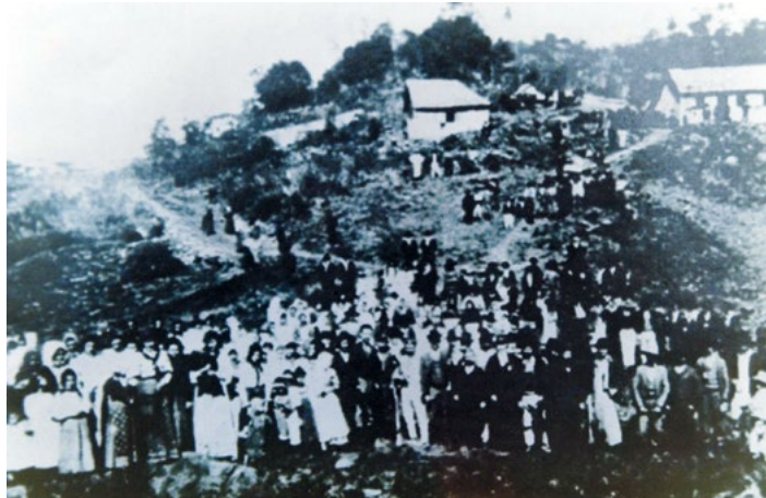
Revolta do Quebra-Quilos em 1874