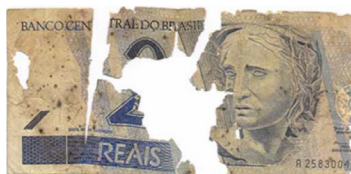
Fragmentos de cédula que isoladamente não apresentam dimensões superiores a 50% das dimensões originais.