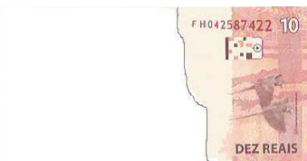
Fragmento com dimensão inferior a 50% do tamanho original da cédula, mesmo possuindo numeração.