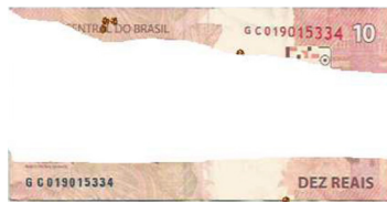
Fragmentos de cédula que, juntos, não fazem área superior a 50% das dimensões originais.