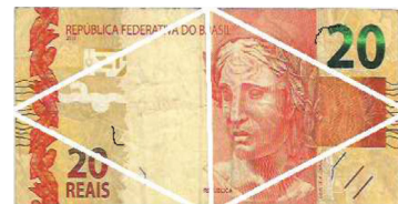
Vários fragmentos, mesmo justapostos, nenhum deles com mais da metade das dimensões originais.