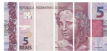
Fragmentos de cédula, justapostos, mas nenhum deles possui mais da metade das dimensões originais.