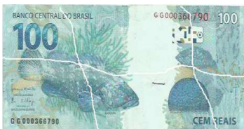
Cédula formada por vários fragmentos, nenhum deles com mais da metade das dimensões originais.