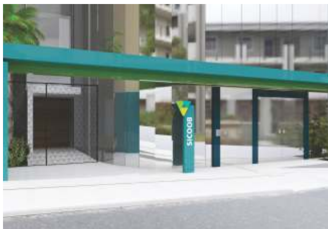
A OBRA ESTÁ A TODO VAPOR E TEM SUA PREVISÃO DE INAUGURAÇÃO AINDA EM 2019

Desde o lançamento da Pedra Fundamental, no dia 26 de julho de 2017, a obra da nova sede da Cooperativa está a todo vapor, enchendo os olhos de quem tem a oportunidade de admirá-la de perto.