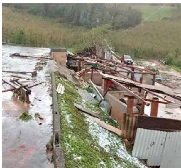
Lavouras de café do Sul de Minas foram as mais afetadas

Fotos: Divulgação / Emater-MG Sites: G1 e Canal Rural