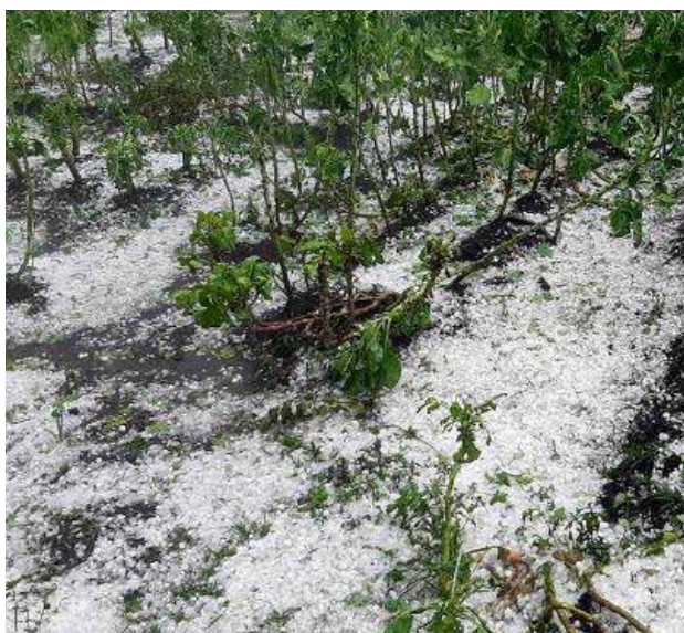
Granizo no Sul de Minas

Neste momento delicado, o Sicoob Credivass criou uma Linha Emergencial para Recuperação de Lavouras a fim de mitigar os efeitos negativos causados aos associados. Em consonância com os princípios e valores do cooperativismo, seguimos o propósito de sermos a solução financeira aos nossos cooperados, oferecendo-lhes a oportunidade de um futuro melhor.