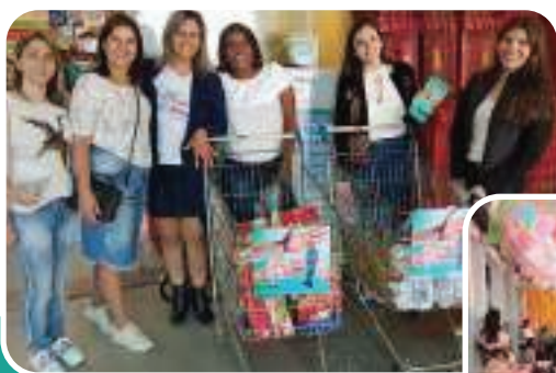
• Arrecadação Dia C.

de Proteção e Assistência aos Condenados, CEIAA- Centro de Educação Infantil Arlete Antunes, FARASVEC- Fundação e Associação para Reintegração e Assistência Social a Viciados e Carentes, FAZENDA DE RECUPERAÇÃO NOVO CAMINHO, FUNDAÇÃO CHIQUITA PERILLO, LAR SÃO VICENTE, SOS - Serviço de Obras Sociais.