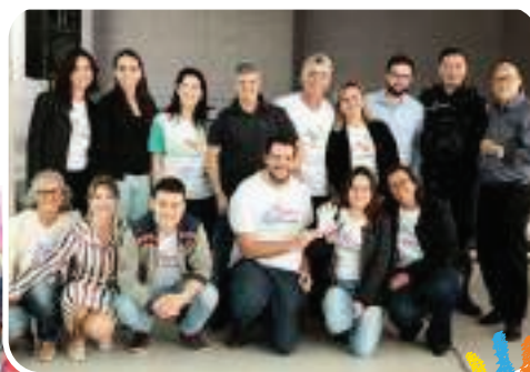
• Encerramento Dia C