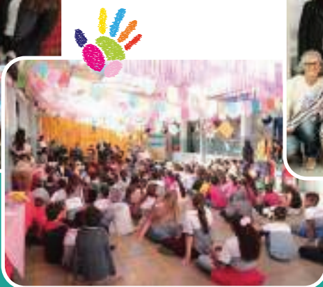
• Dia C nas escolas.